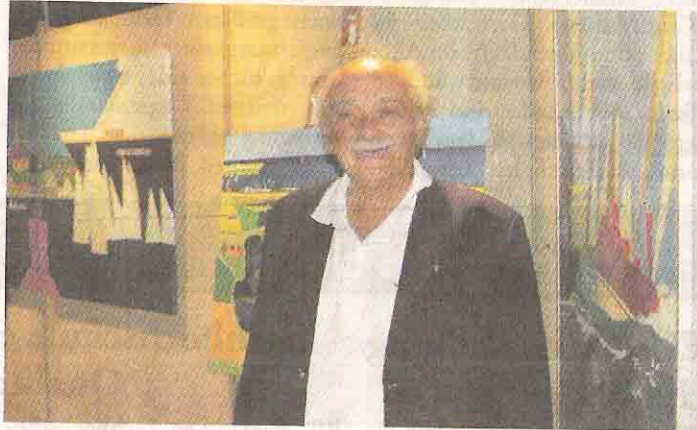
Der italienische Künstler Franco Costa zeigt in seinen rund 40 Arbeiten, die er im Probstei-Museum Schönberg ausstellt, auch seine Liebe zu Schleswig-Holstein.

nas. Schönberg. Die Eröffnung der Ausstellung „Arte Vita 2007“ des italienischen Künstlers Franco Costa wurde am Sonntag im Rahmen des Internationalen Museumstages gebührend gefeiert. In den historischen Räumen des Probstei-Museums in Schönberg versammelten sich zahlreiche Gäste, um die Arbeiten des bekennenden Schleswig-Holstein-Liebhabers zu bestaunen. Bis auf die letzten Reihen waren alle Plätze besetzt, viele der Kunstinteressierten mussten die